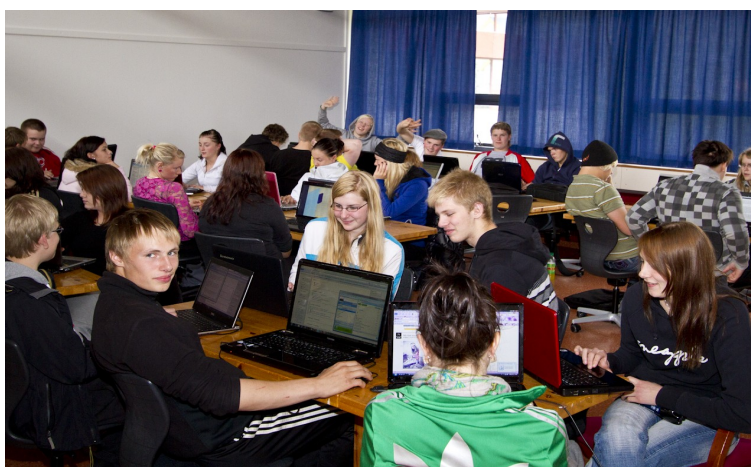
Nemendur að störfum.