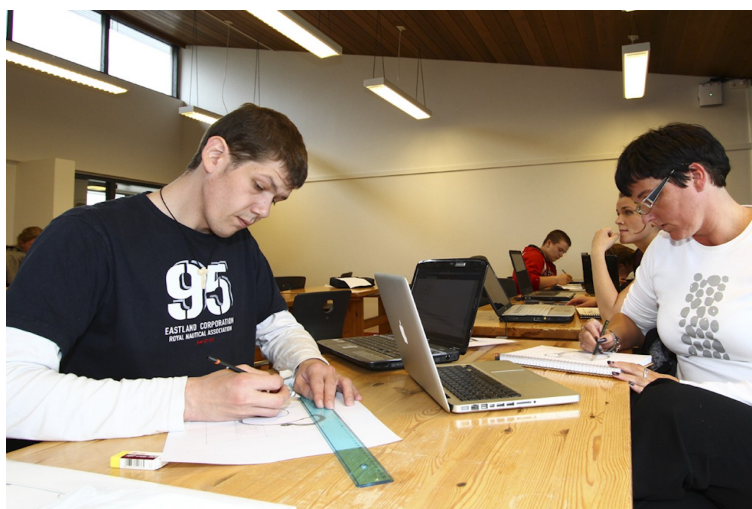
Nemendur við nám.

Skólabyrjun gekk afar vel, starfsmenn og nemendur ánægðir og áhugasamir.