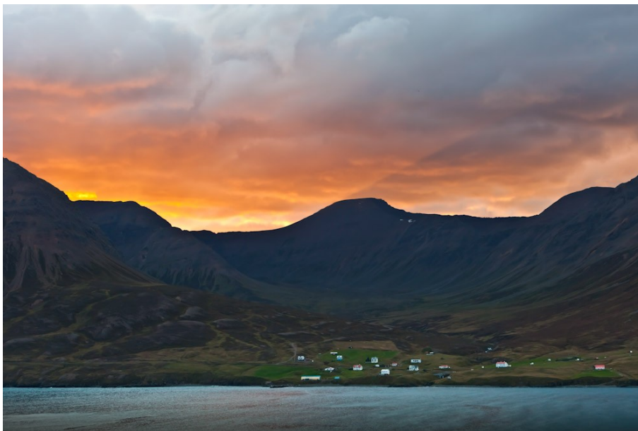
Kleifar og Ytriárdalur í Ólafsfirði.

Ákveðið var að ganga til samstarfs við hugbúnaðarhúsið Stefnu á Akureyri sem hefur mikla reynslu af opnum hugbúnaði.