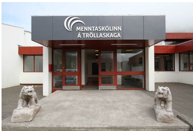
Anddyri skólans í ágúst 2010.

Skólinn er með styrk í verkefnið Úrgangslit úr sprotasjóði, 500.000. Því verkefni er lýst nánar í kafla um þróunarverkefni.